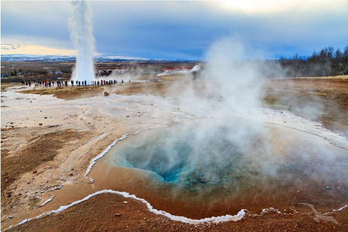
Geysir Strokkur, Island

Die Crew der MS Amera erwartet Sie in Bremerhaven zu dieser wundervollen Kreuzfahrt, die sich rund um Schottland und Island dreht. Die schottischen Mid- und Highlands sowie die vorgelagerten Inseln verzaubern Besucher mit ganz eigenem Charme. Island, wo Sie gleich fünf Ziele anlaufen, glänzt mit Geysiren und Wasserfällen, grünen Landschaften und eigentümlichen Geschichten, die Sie sich am besten selbst anhören.